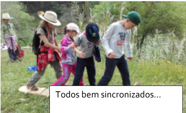
Todos bem sincronizados...

No dia 28 de abril o 1º ciclo e o pré-escolar foram até à aldeia de Santa Clara-a-Velha para participar na prova de orientação. Depois dos grupos formados e mapa na mão lá fomos nós por caminhos de Santa Clara...O divertimento foi garantido... Várias balizas e atividades para todos os gostos.