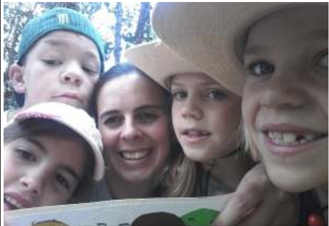
Uma selfie para comemorar! Tivemos o nosso cartão com todos os smiles!!