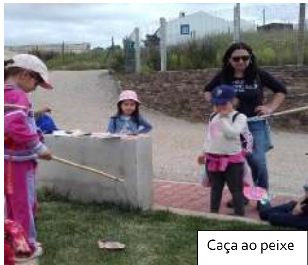
Caça ao peixe