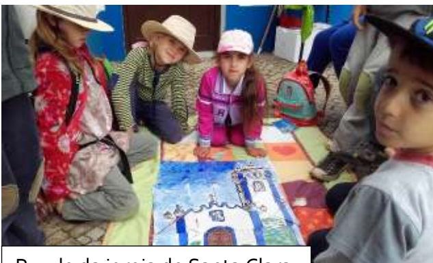
Puzzle da igreja de Santa Clara de Assis