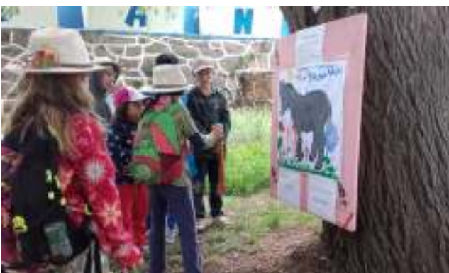
De olhos vendados lá andamos a colocar o rabito no burrito!